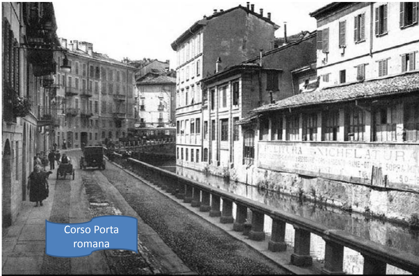
Corso Porta romana