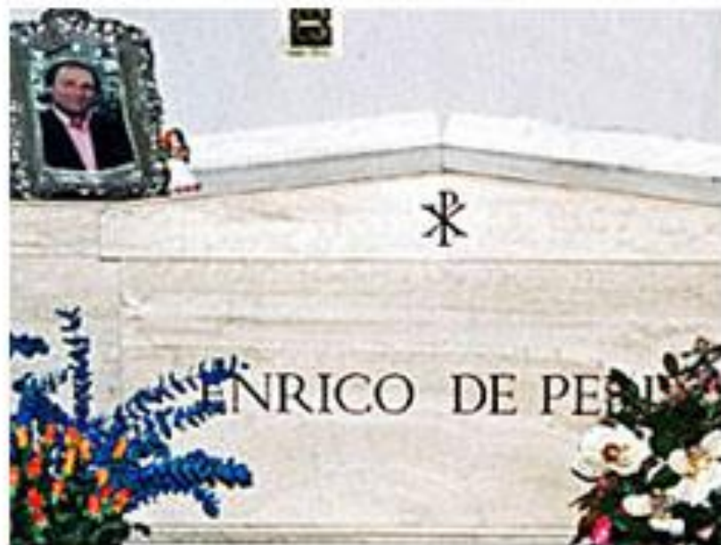
La tomba di Enrico De Pedis in Sant'Apollinare a Roma